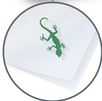
RŮZNÉ BARVY FÓLIÍ