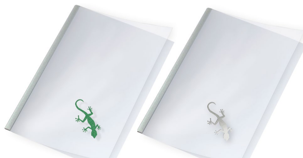
UniCover Flex & UniCover Spine