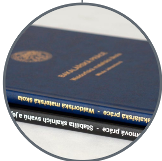
TISK NA HŘBET